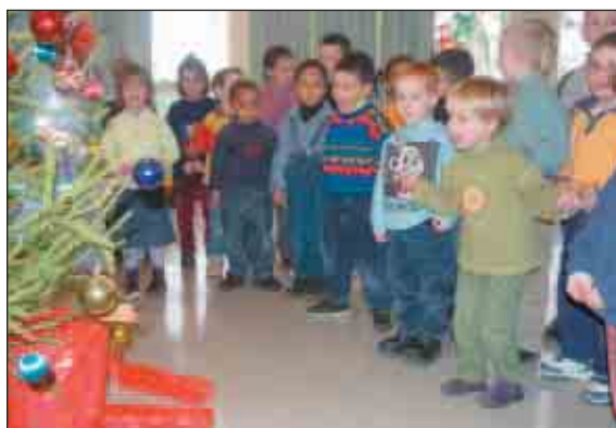
Le Père Noël est passé aussi à la cantine.