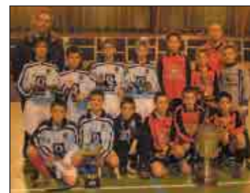
Les finalistes benjamins

Les finalistes Stade de Reims et Tinqueux qui gagnent après prolongation et tirs au but.