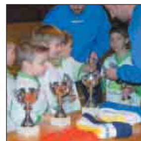
Saint Martin, équipe débutants